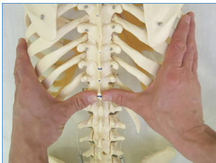
Abb. 3: Palpation der Dornfortsätze

te, die auf dem inneren Blasen-Ast zu lokalisieren sind. Diese Akupunkturpunkte stehen in direktem Bezug zu den Organen.