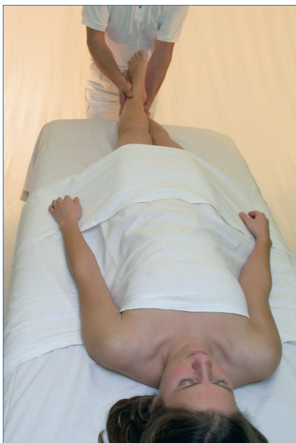
Abb. 3: Palpation der Dornfortsätze

Zum Abschluss der gesamten Wirbelsäulenthherapie und des punktuellen Ausgleichs kann der Patient nochmals in Rückenlage über kleine Schwingungsimpulse sanft harmonisiert werden (vgl. Abb. 4).